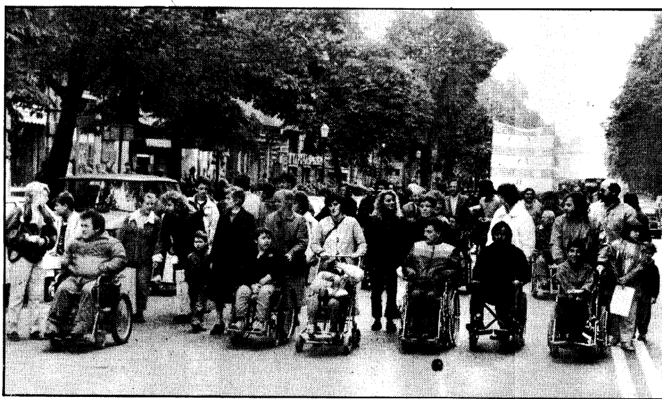
Il corteo di protesta contro le barriere architettoniche mentre transita lungo viale Papa Giovanni XXIII.