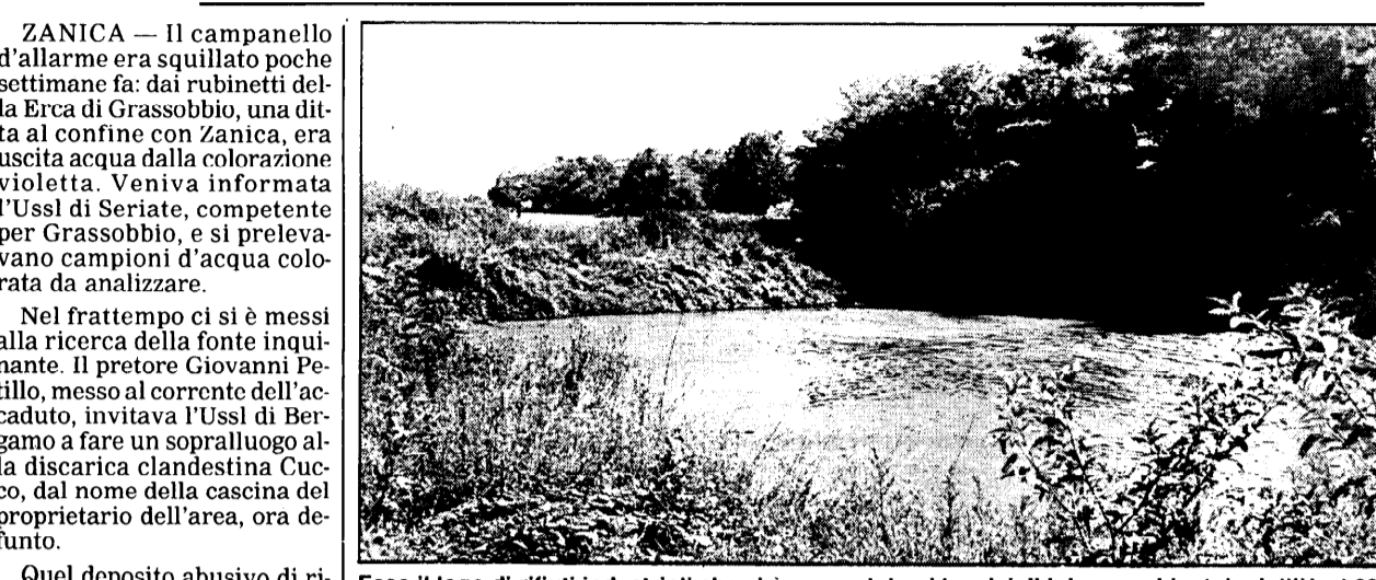
Ecco il lago di rifiuti industriali che si è presentato ai tecnici di igiene ambientale dell'Ussl 29. Si trova nella zona nord-est di Zanica, in aperta campagna, e misura 30x40 metri, 1200 metri quadrati di superficie.

«Quando siamo arrivati sul posto, però, siamo rimasti di sasso», dice il dott. Giampiero Valsecchi, responsabile dell'Unità operativa di igiene ambientale dell'Ussl di Bergamo,