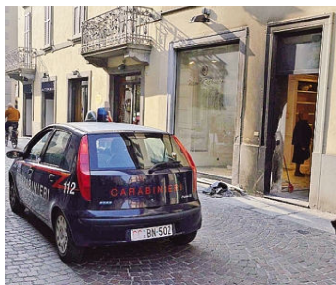
I carabinieri davanti al negozio di via Roma dopo l'incendio

di mettere in evidenza quanti e quali beni sono realmente destinati a un riutilizzo per utilità sociale, così come indica la legge n. 109/96 che prevede l'assegnazione dei patrimoni e delle ricchezze di provenienza illecita a quei soggetti - associazioni, cooperative, Comuni, Province e Regioni - in grado di restituirli alla cittadinanza, tramite servizi, attività di promozione sociale e lavoro. I Bergamasca, attualmente, sono 28 gli immobili censiti, soprattutto unità immobiliari, box, capannoni e terreni. Si trovano ad Alzano, Berbenno, Bergamo, Brembate, Cornalba, Dalmine, Foppolo, Fornovo San Giovanni, Gorlago, Lovere, Seriate, Suisio e Terno.