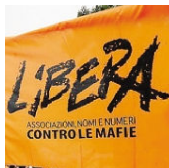
Anche a Bergamo opera «Libera»

Nel 2009, seguendo lo stile del coordinamento di «Libera» Bergamo, si è costituito il sottogruppo, formato da quattro donne, per studiare e analizzare i beni confiscati presenti sul territorio provinciale. «L'obiettivo è stato quello di creare una mappatura dei beni confiscati: quindi capire inizialmente la dislocazione dei beni, le motivazioni della confisca, lo stato dei beni», spiegano da «Libera». L'attenzione principale del gruppo di lavoro è stata quella