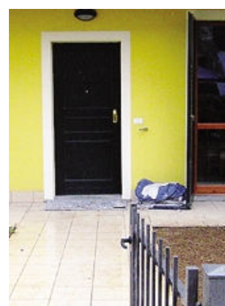
La casa dei papà separati di Terno

La «Casa dei papà», inaugurata l'11 ottobre, si trova a Terno d'Isola in via Boccaccio, zona Roccolo 2, e dà alloggio a quattro papà. La gestione è stata affidata, a seguito di un bando, all'associazione «Papà separati Lombardia». L'amministrazione comunale, quando ha saputo del bene confiscato alla mafia nel 2013, si è attivata riuscendo a ottenerla per il progetto sociale rivolto ai padri, che a seguito di