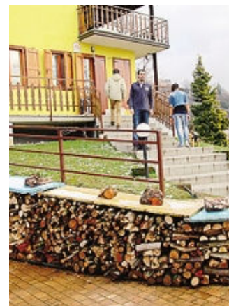
La casa-famiglia di Berbenno

divorzio o separazione, vivono in condizioni di disagio socioeconomico. Dopo aver affidato la gestione all'associazione «Papà separati Lombardia» si è dato avvio ai lavori di sistemazione della villetta a schiera, in quanto gli arredi interni erano stati distrutti appositamente da chi è stato costretto a lasciare la villetta a seguito di confisca.