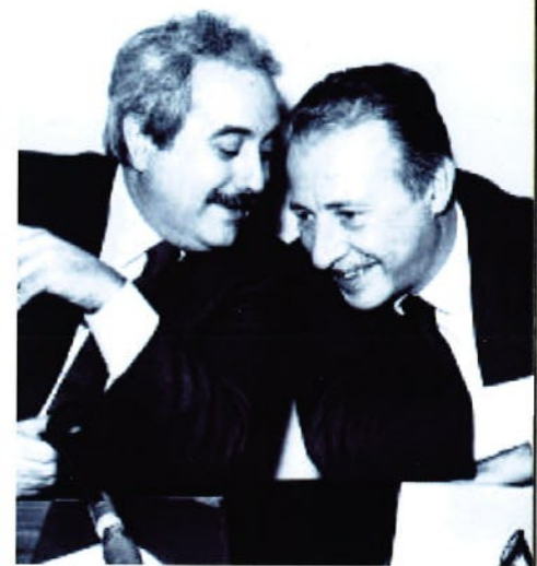
Giovanni Falcone e Paolo Borsellino, magistrati (1992)