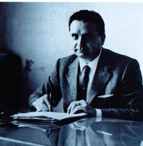
Rocco Chinnici, magistrato (1983)