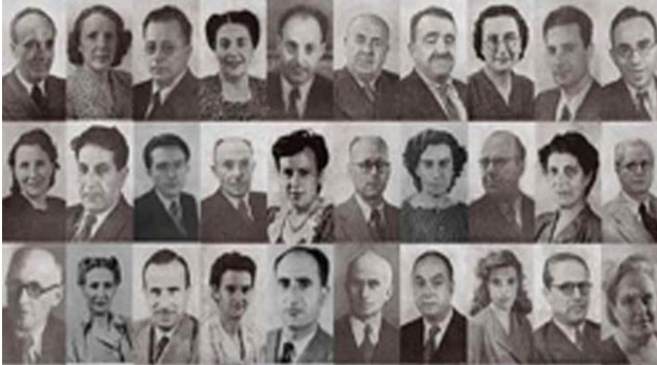
Algunas fotos de los "padres" y "madres" constituyentes.

Este artículo también está disponible en: Italiano ( https://www.pressenza.com/it/2016/12/referendum-e-spirito-olimpico/ )