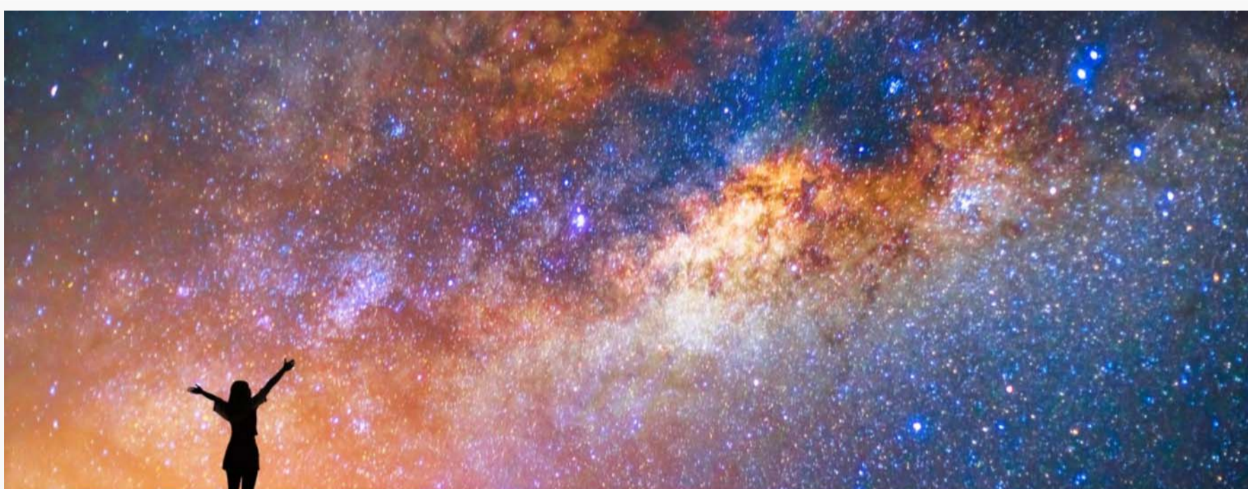
milky way, star, with happy girl on the mountain

Gli interrogativi di Faust. La realtà esiste davvero? La domanda riaffiorava in modo discontinuo nella sua mente. Come un fotone quando lo si cerca. Eccolo e poi scompare. Come un surfista tra le onde? A ben riflettere, come un raggio di luce che attraversa un prisma, le questioni si potevano dividere in domande più specifiche. Che cos'è la realtà? E l'esistenza? E la verità?