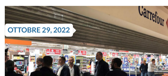
Il Carrefour di Assiago