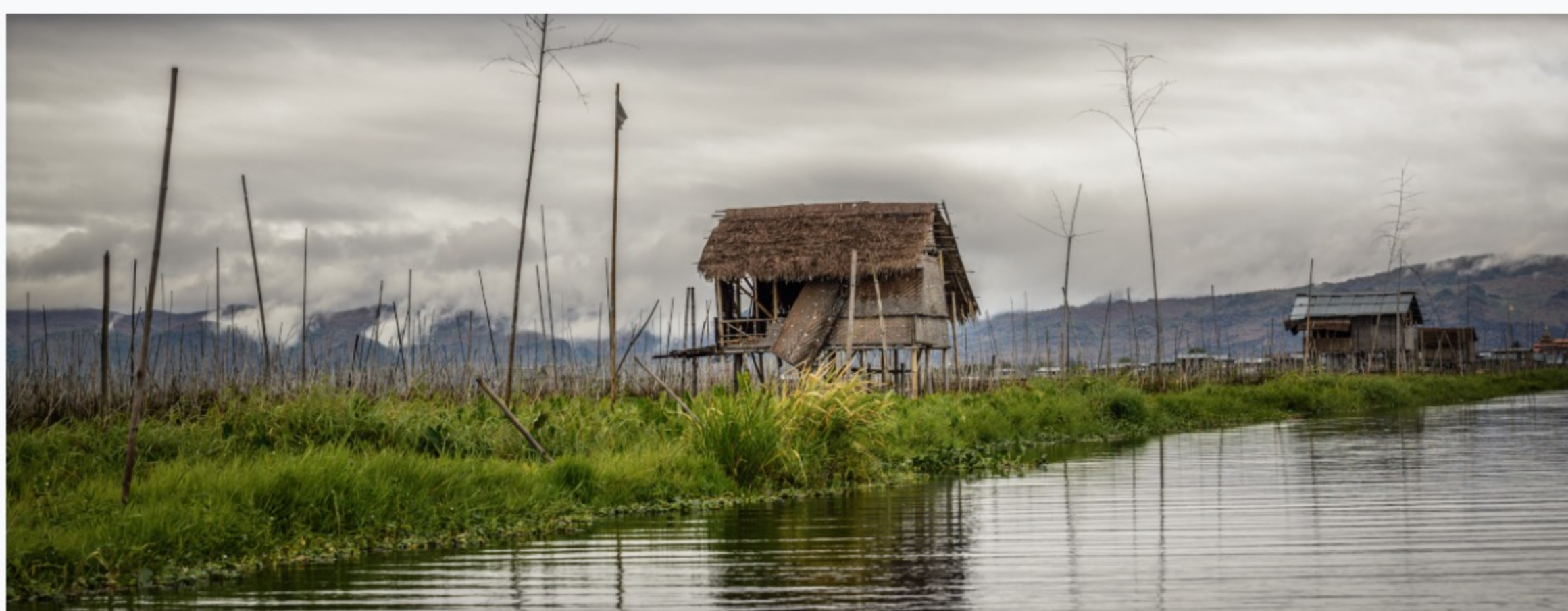
Lago Inle, Myanmar

A Davos, in Svizzera, è in corso lo Word Economic Forum. A monte di guerra in Ucraina e problema energetico Stanno disuguaglianze che hanno raggiunto livelli mai visti