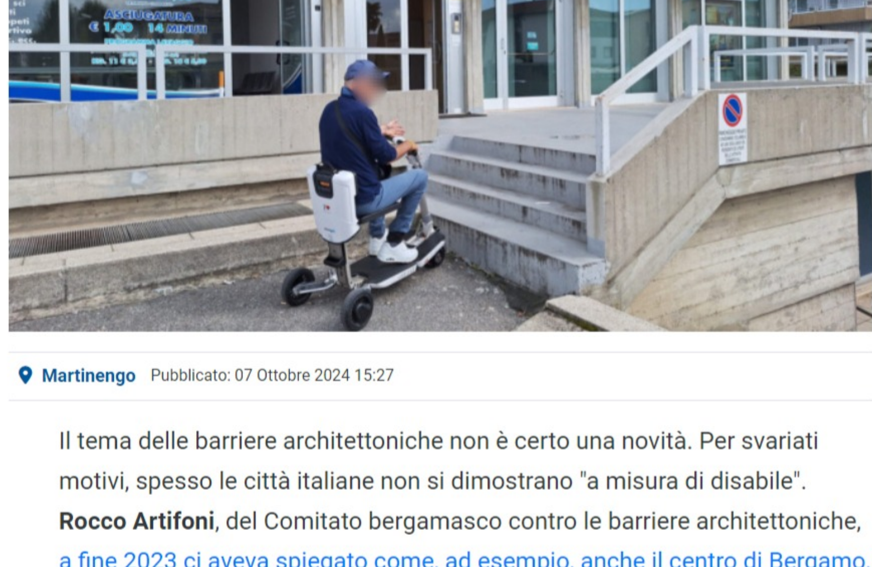
Martinengo Pubblicato: 07 Ottobre 2024 15:27

Un uomo di 62 anni ha denunciato ai colleghi di PrimaTreviglio la situazione: nonostante la segnalazione sia arrivata un anno e mezzo fa, ancora non è stato fatto niente