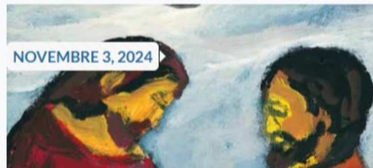
Tempera di Giuseppe Sala