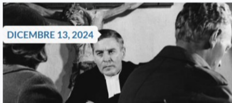
Un'immagine di "Luci d'inverno"

"...a prescindere da qualsiasi cosa, devi celebrare la tua messa"